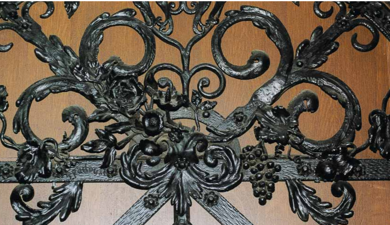
Detail van het doopvonthek in de O.L.V.-basiliek te Kortzenbos.

S IERSMID PIERRE RADOUX was een geboren Truienaar (1864-1939). Minder gekend dan Lodewijk Van Boeckel, de Lierse Vulcanus en smid van hanen en arenden, liet hij nochtans een uitgebreid werk na. Zijn bekendste schepping is de dubbele adelaar op het Sint-Truidense perron, geplaatst in 1930. 'Pie' Radoux wist in het volle smidsvuur een ziel te toveren in weerbarstig ijzer. Zijn oeuvre kende dan ook succes op tentoonstellingen in 1907, 1926, 1927 en 1930.