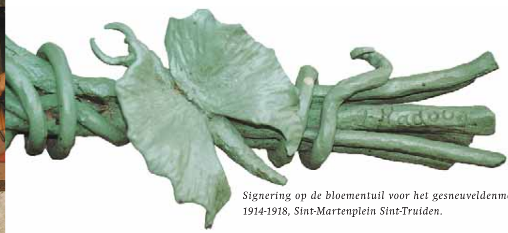
Signering op de bloementuil voor het gesneuveldenmonument 1914-1918, Sint-Martenplein Sint-Truiden.