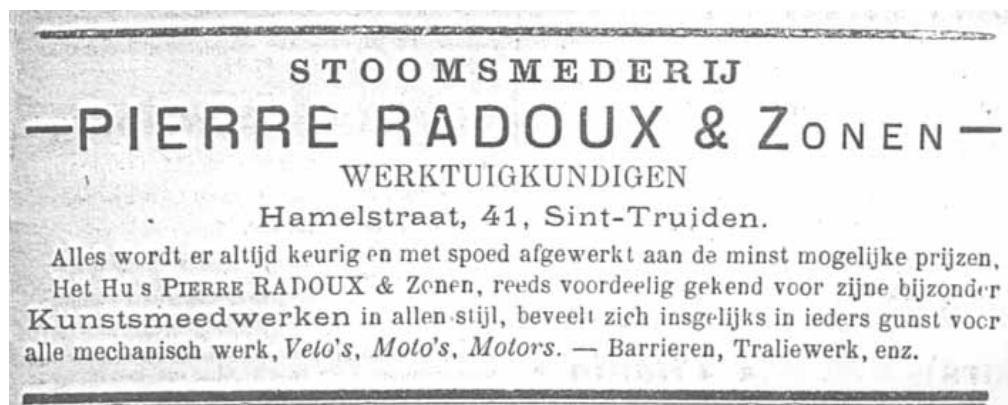
Advertentie in 'De Stem van Haspengouw' van 18 april 1914.