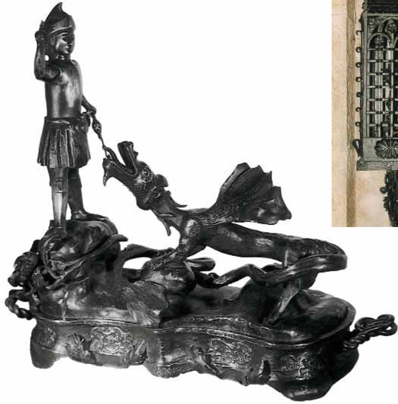
Sint-Michaël en de draak, het gesmede pronkstuk op de tentoonstellingen in 1927 en 1930. Verzameling familie Boelen.

de hand uit de hete ijzerklomp getrokken, gedraaid, gehamerd en gebeiteld.